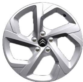
Jante aliaj 18" SWIRL (Gris Eclat Brillant) (225/55 R18) (ZHC7)