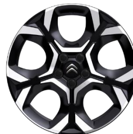
Jante aliaj diamantate 18" PULSAR (225/55 R18) (ZHXI)