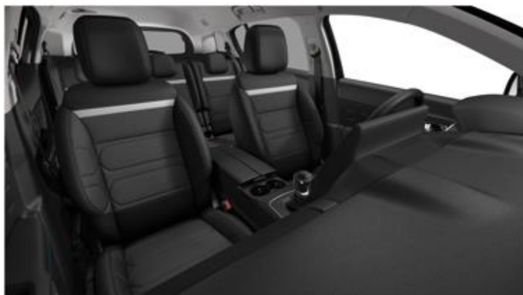
Tapiterie mixta Metropolitan Black (XCAB)