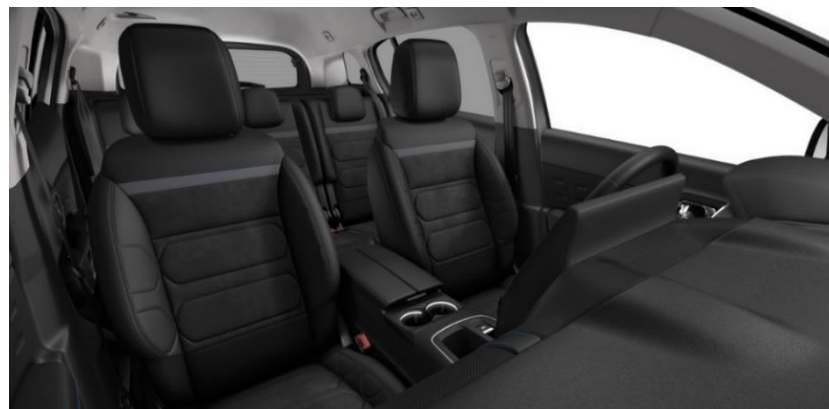
Tapiterie mixta Urban Black (0JFD)