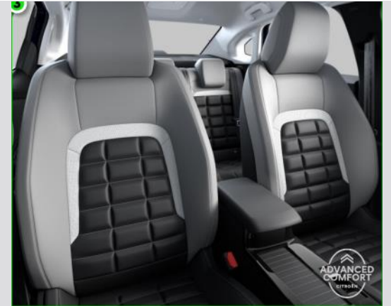
DTAB: Tapiterie mixta Metropolitan Grey (TEP/textil bi-ton negru/gri deschis)