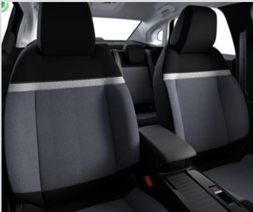
SOFY: Tapiterie textila Meanwhile (gri/negru)