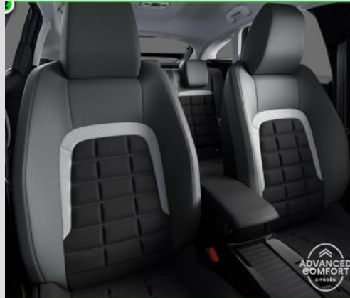
DQAB: Tapiterie mixta Urban Grey (textil/TEP bi-ton gri/negru)