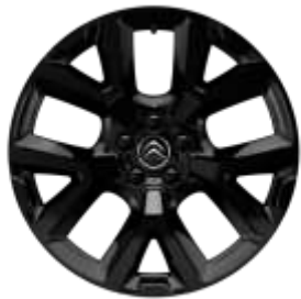
Jante aliaj Full Black 19" ART (Tall & Narrow) (205/55 R19) (ZHNY)