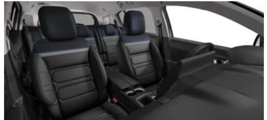
Tapiterie piele Hype Black (U0FO)