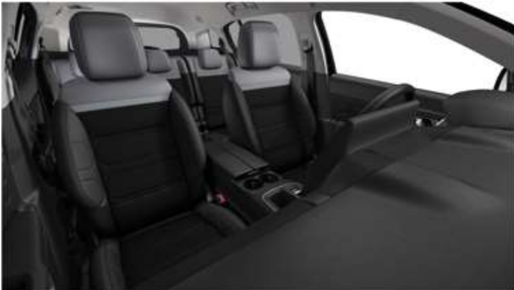
Tapiterie mixtă Metropolitan Grey (FNFA)