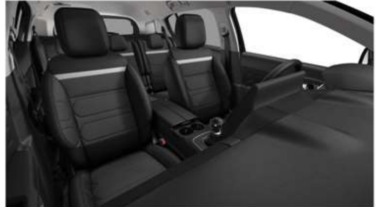
Tapiterie mixtă Metropolitan Black (XCAB)