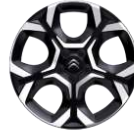
Jante aliaj diamantate 18" PULSAR (225/55 R18) (ZHXI)