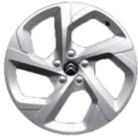
Jante aliaj 18" SWIRL (Gris Eclat Brillant) (225/55 R18) (ZHC7)