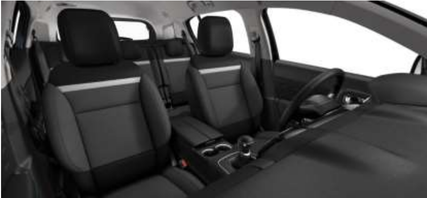
Tapiterie textilă Silica Grey (51FR)