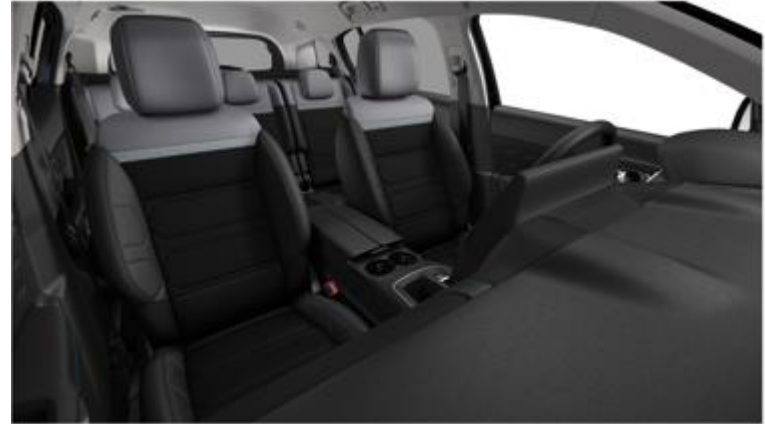
Tapiterie mixta Metropolitan Grey (FNFA)