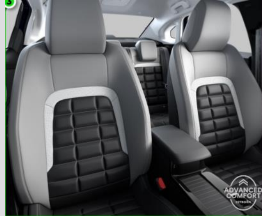
DTAB: Tapiterie mixta Metropolitan Grey (TEP/textil bi-ton negru/gri deschis)