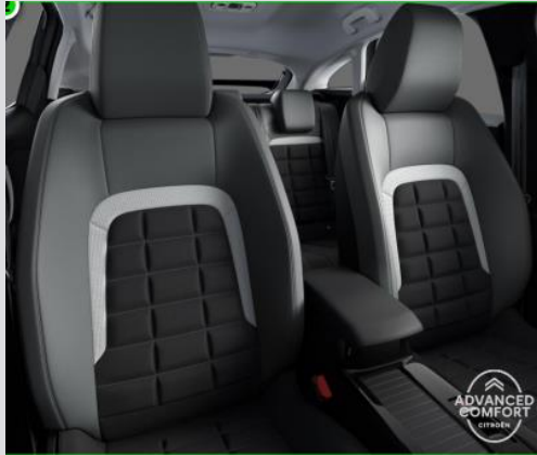
DQAB: Tapiterie mixta Urban Grey (textil/TEP bi-ton gri/negru)