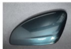
NEW Libeccio Blue