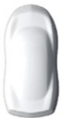
Kaolin White solid