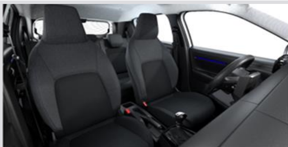
NAFX: Tapiterie textila Grey (gri / negru)