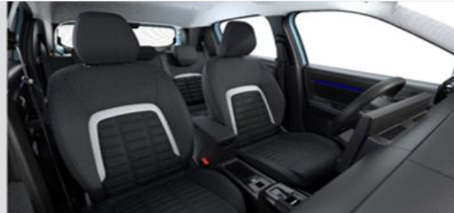
NBFX: Tapiterie textila (gri / negru) cu banda gri