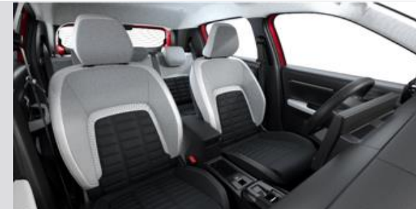
NHFX: Tapiterie textila TEP / textil bi-ton negru / gri cu banda gri