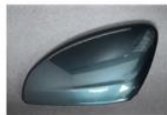
NEW Libeccio Blue