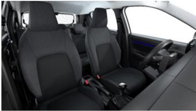
NAFX Tapiterie You!