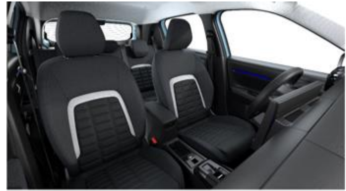
NAFX Tapiterie Plus